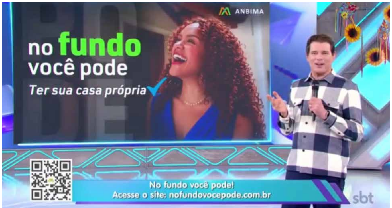
Otros contenidos y materiales publicitarios creados para la campaña "No Fundo Você Pode".