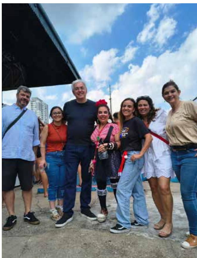
Registros de la fiesta de fin de año de 2025 con los integrantes y niños del Instituto EduSporte.