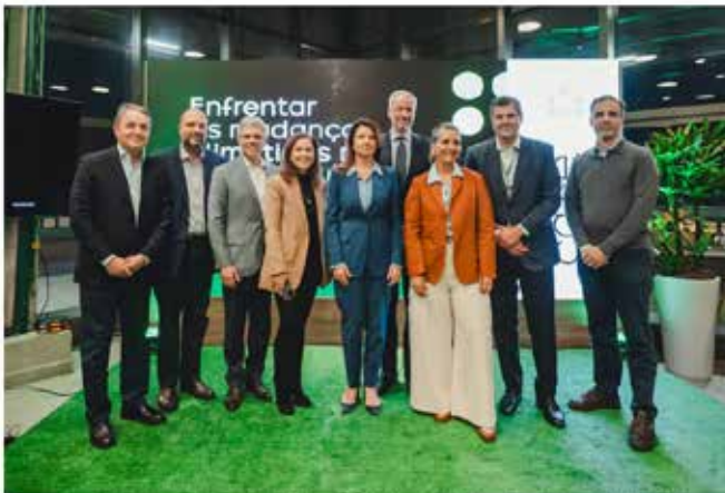
Empresas buscam visibilidade a soluções climáticas do Brasil de vésperas da COP30 | Executivos de Brasileiro, Itaú Unibanco, Natura, Nestlé e Vale empresas lançam solução conjunta para ampliar protagonismo do Brasil na agenda climática global

Brasileiro, Itaú, Itaú Unibanco, Natura, Nestlé e Vale lançam solução conjunta para ampliar protagonismo do Brasil na agenda climática global no ano que país recebe a conferência da ONU, com objetivo de destacar soluções de apelo universal