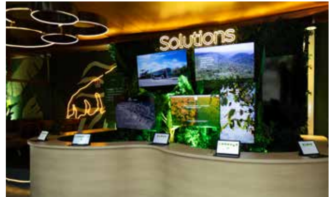
Materiales desarrollados y resultados en la prensa

“La entrega de este proyecto de comunicación para C.A.S.E. evidencia la capacidad de sinergia entre las áreas de FR, con planificación estratégica y entregas consistentes a lo largo de seis meses”, concluye Nadalon.