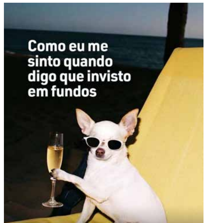
Meme creado para la campaña de ANBIMA

La entrega solo fue posible gracias al trabajo integrado entre los diferentes frentes del Grupo Nexcom. La campaña reunió a Fato Relevante, integrando PR, digital y planificación, en colaboración con Talent y Charisma. El reconocimiento llegó con el Premio Jatobá, que destacó la campaña como un ejemplo de comunicación 360° pensada para impulsar transformación cultural.