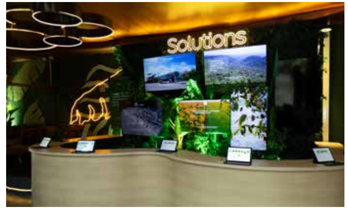
Materiais desenvolvidos e resultados na imprensa