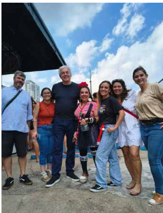
registros da festa de final de ano de 2025 com os integrantes e crianças do Instituto EduSporte