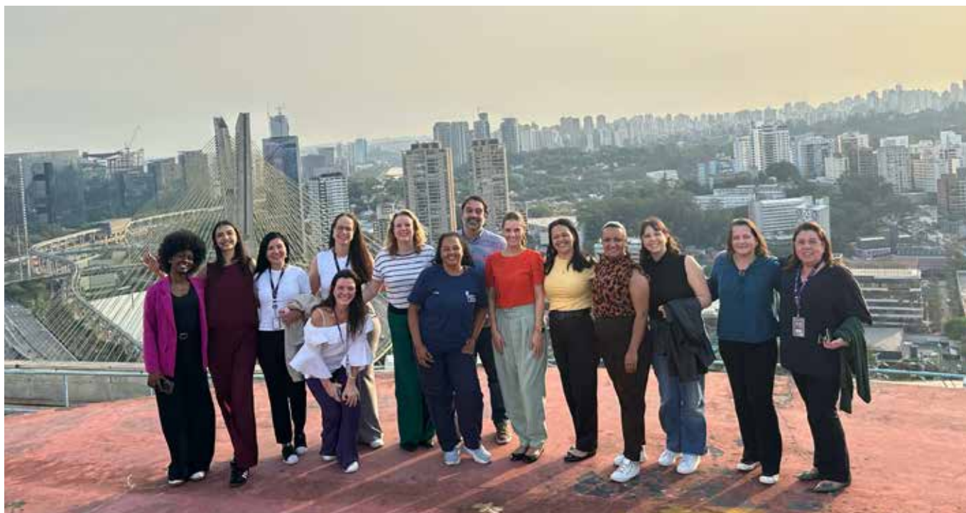
Aula de relaxamento nas alturas para colaboradores da Viatriis, como ação de engajamento e cuidado durante a campanha.