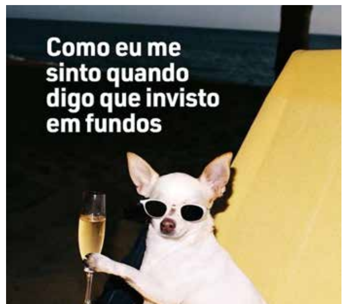
meme criado para a campanha da ANBIMA

A entrega só foi possível graças à atuação integrada das diferentes frentes do Grupo Nexcom. A campanha reuniu a Fato Relevante, integrando PR, digital e planejamento, em conjunto com a Tridente e a Charisma. O reconhecimento como finalista do Prêmio Jatobá consolida o case como um exemplo de comunicação 360 pensada para gerar transformação cultural.